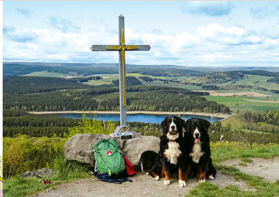
Blick vom Bärenstein zur Talsperre Cranzahl.

deaus weiter. Der Weg endet direkt an der Schutzhütte Habichtsberg ④, die mit ihrer herrlichen Lage zum Verweilen einlädt. Vom Habichtsberg geht es nun ein kleines Stück auf selbem Wege zurück und dann gleich den ersten Weg nach links am Waldrand entlang bis zum Asphaltweg. Vor uns erhebt sich das Gipfelziel dieser Wanderung, der Bärenstein. Wir biegen nach links in den Asphaltweg ein und folgen gleich danach der Ausschilderung zur Talsperre Cranzahl nach rechts. Nach einer Viertelstunde kommen wir zu einer Kreuzung mit Schutzhütte. Hier gehen wir nach links weiter. Am Ende des Waldes biegen wir rechts ab und überqueren die Sperrmauer der Talsperre Cranzahl ⑤. Auf der anderen Seite wandern wir auf dem gelb markierten Wanderweg nach links, welcher dann nach etwa 500 Metern rechts in den Wald abweigt. Nun geht es steil bergauf. An einer Gabelung fol-