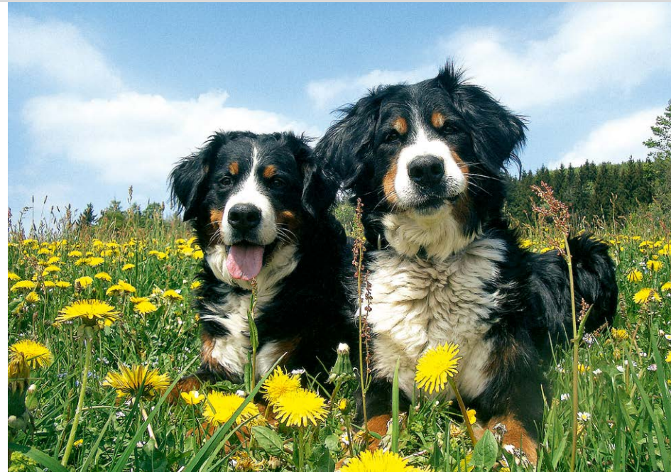
Gusti und Senta am Fuße des Bärensteins.

Gegenüber der Einfahrt zum Parkplatz 1 nehmen wir den grün markierten Wanderweg Richtung Kretscham. Dieser führt uns am Waldrand entlang, überquert anschließend eine Wiese und stößt schließlich an einer Kreuzung auf einen Querweg. Hier gehen wir nach links weiter und kommen nach fünf Minuten an eine schmale Straße, in die wir nach rechts einbiegen. Wir befinden uns jetzt auf dem Wanderweg »Bärenweg«, dem wir bis zum Sportplatz folgen. Direkt nach dem Sportplatz halten wir uns rechts und wandern auf dem asphaltierten Feuerturnweg in den Wald hinein. Wir passieren die Kreuzung des Pascherweges